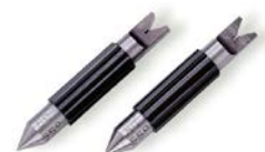
ВСТАВКИ ТА УСТАНОВЧІ МІРИ ЗАМОВЛЯЮТЬСЯ ДОДАТКОВО