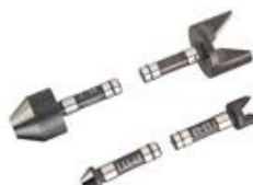
ВСТАВКИ ДЮЙМОВІ 55°