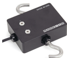
РОЗТЯГУВАННЯ ТА СТИСК