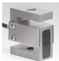
РОЗТЯГУВАННЯ ТА СТИСК