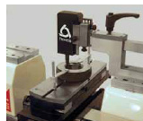
Калібрування різьбових калібрів-кілець