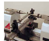
Калібрування різьбових калібрів-пробок