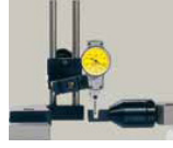
Калібрування важільних індикаторів