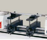
Калібрування нутромірів мікрометричних