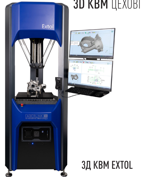
3D КВМ EXTOL