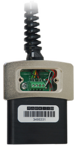
РОЗТЯГУВАННЯ ТА СТИСК